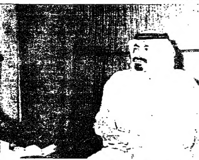
مع امير قطر الشيخ خليفة بن حمد آل ثاني